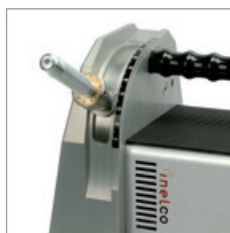
Schleifen der Elektrode im gewünschten Winkel.