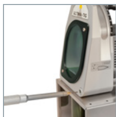
Präzises Justieren der Einstell-schablone.