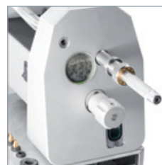
Den Handgriff drehen, um die Elektrode zu kürzen.