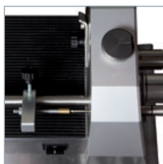
Déterminez la longueur de la coupe de l'électrode