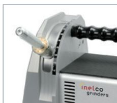
Ângulo de afiação de 7,5 a 90° resulta em ângulos precisos de 15 a 180°.