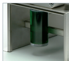
Recipiente descartável lacrado para coleta e eliminação do pó da afiação.