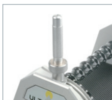
A ponta do eletrodo pode ser afiada em 1/10mm por p. em 90°