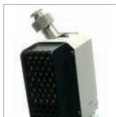
Filtre avec collecteur de poussière intégré, facile à remplacer.