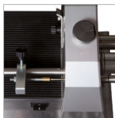
Selecciona la longitud del corte